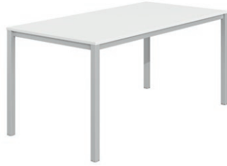
Σταθερό ύψος / Fixed height