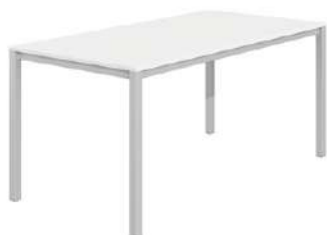
Σταθερό ύψος / Fixed height