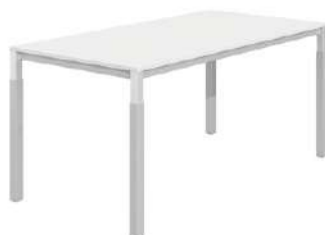
Ρυθμιζόμενο ύψος / Adjustable height