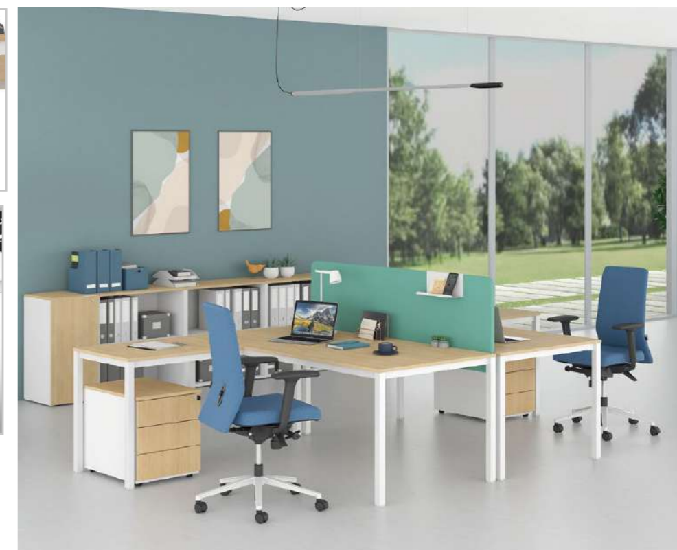
Different choices of horizontal or vertical cable management.