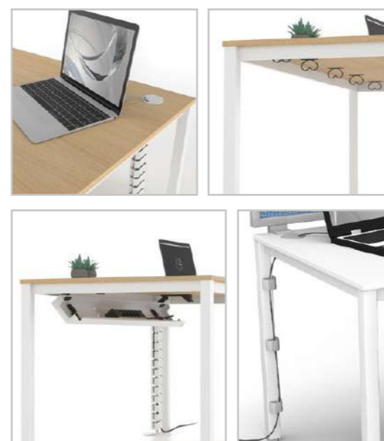
Δυνατότητα οριζόντιας και κάθετης διέλευσης των καλωδίων με διαφορετικούς τρόπους.